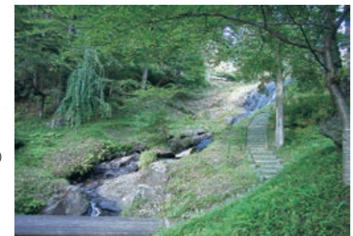
緑と水にあふれる白滝親水公園